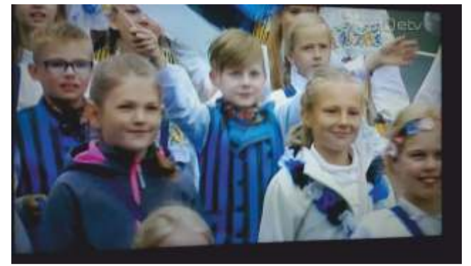
Kui ise kohale ei saa minna, pildistad last telekast.

naersin, et meil pole enam bussis nii palju lapsigi! Ja emmed-issid võtsid meid vastu ka lauluga!