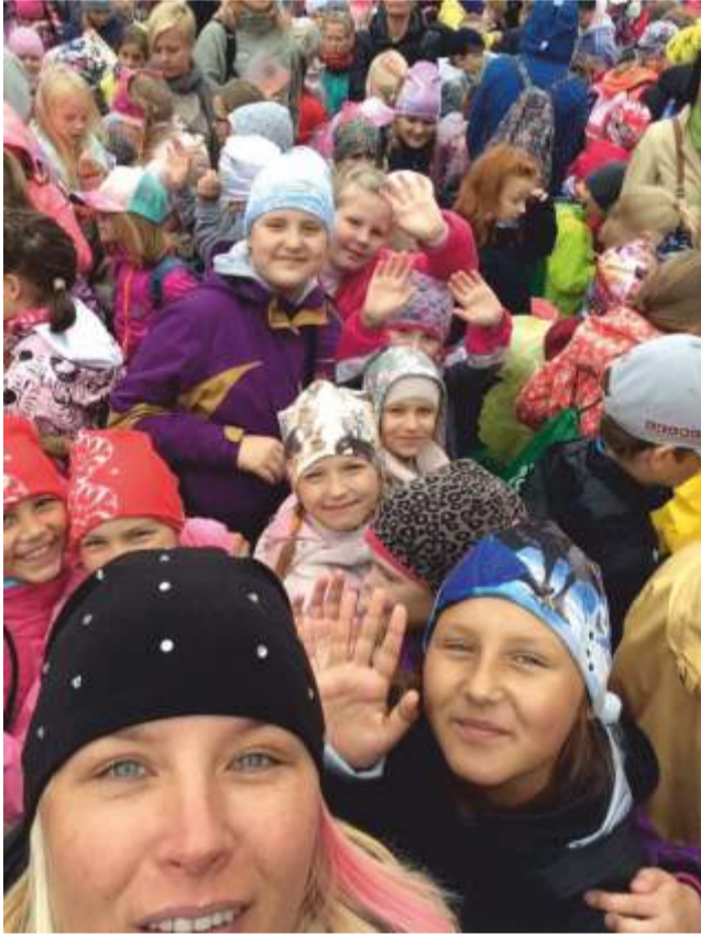
Ka laulupeo juurde käib pildistamine!

Koorijuhhi seisukohast on laulupeoaasta meeletu närvipinge. Repertuaari helikeel läheb aina keerulisemaks. Neid, kes noodikirja loeks, on ju kaduvväike osa. Seda enam olen ma tänulik oma n-ö lõppmeeskondadele, kes sellele „vatile“ vastu pidasid. Kellega me ettelaulmisel käisime ja võiduka lõpuni vedasime.