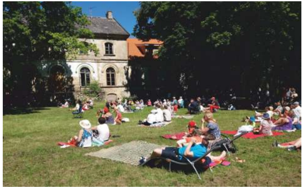
Ilus ilm soosis etenduste nautimist.

Suured tänud kõigile osalejatele, pealtvaatajatele ja