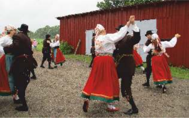
Segapidi tantsulusti ei seganud vihm ega tuul.