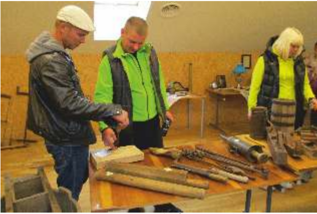
Näitus vanaaja esemete, tööriistade, käsitöö- ja fotonäitusega.