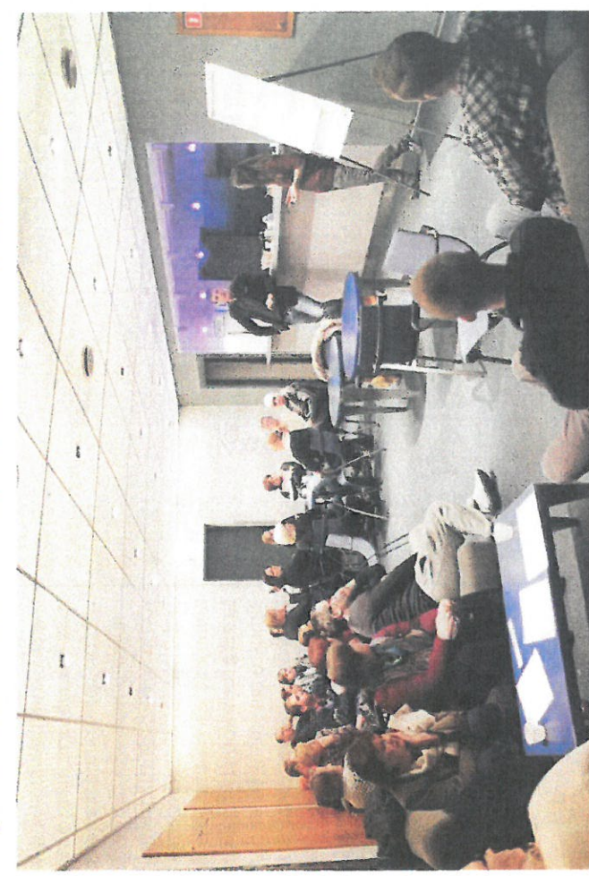
Talgulised osalesid aktiivselt mõttetgevuses.

Kolmas küsimus sisaldas endas ehk selle teema ühte valusamat kohta, sest tihti peale on nii, et sündmusi ja või-