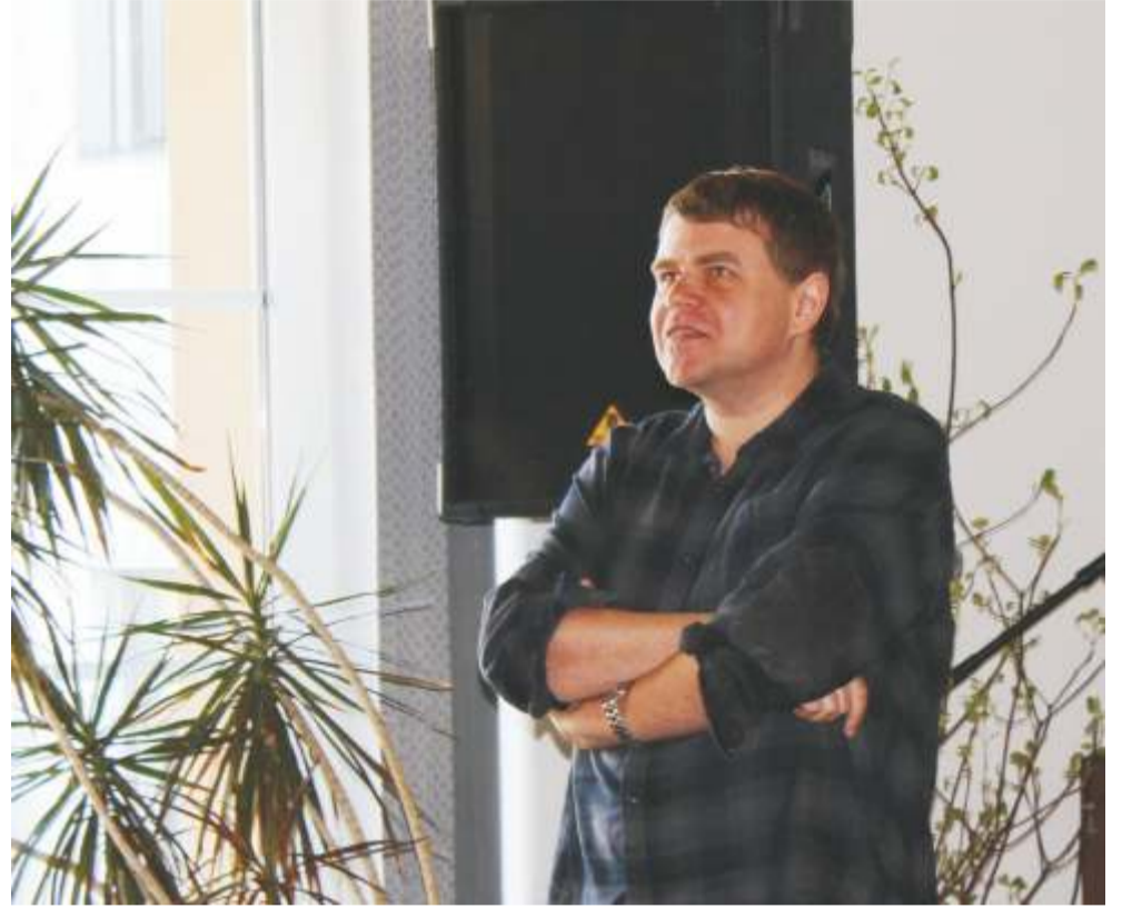
Andrus Kivirähk oma muhedal moel.

Kirjanik Andrus Kivirähk kohtus 21. aprillil Haljala gümnaasiumi õpilastega. Kohtumist gümnaasistidega alustas kirjanik oma jutu „Kõrvaltegelane“ väga ilme-ka ettelugemisega, juhtides tähelepanu kõrvalolija, (-seisja, -tegelase) probleemile. Kõik eestlased teavad