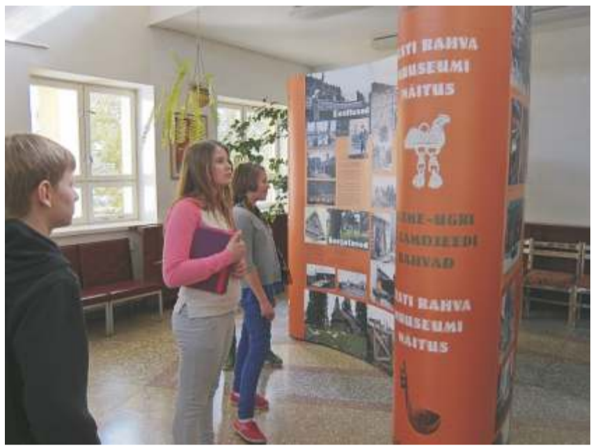
Stend on varustatud paljude piltidega, mis annavad edasi kultuurilist mitmekesisust. Foto:

Stendinäitus on varustatud ohtrate piltidega, mis tehtud