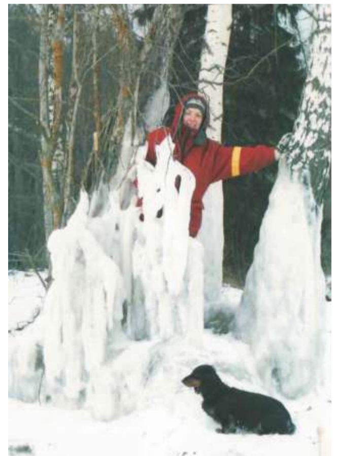
Ka talvel on Eismal ilus.

Lahkumissõnad teevad tohtri kurvaks. „Mul on olnud nii toredad patsiendid. Kurb on, kui kuuled kellegi surmast või