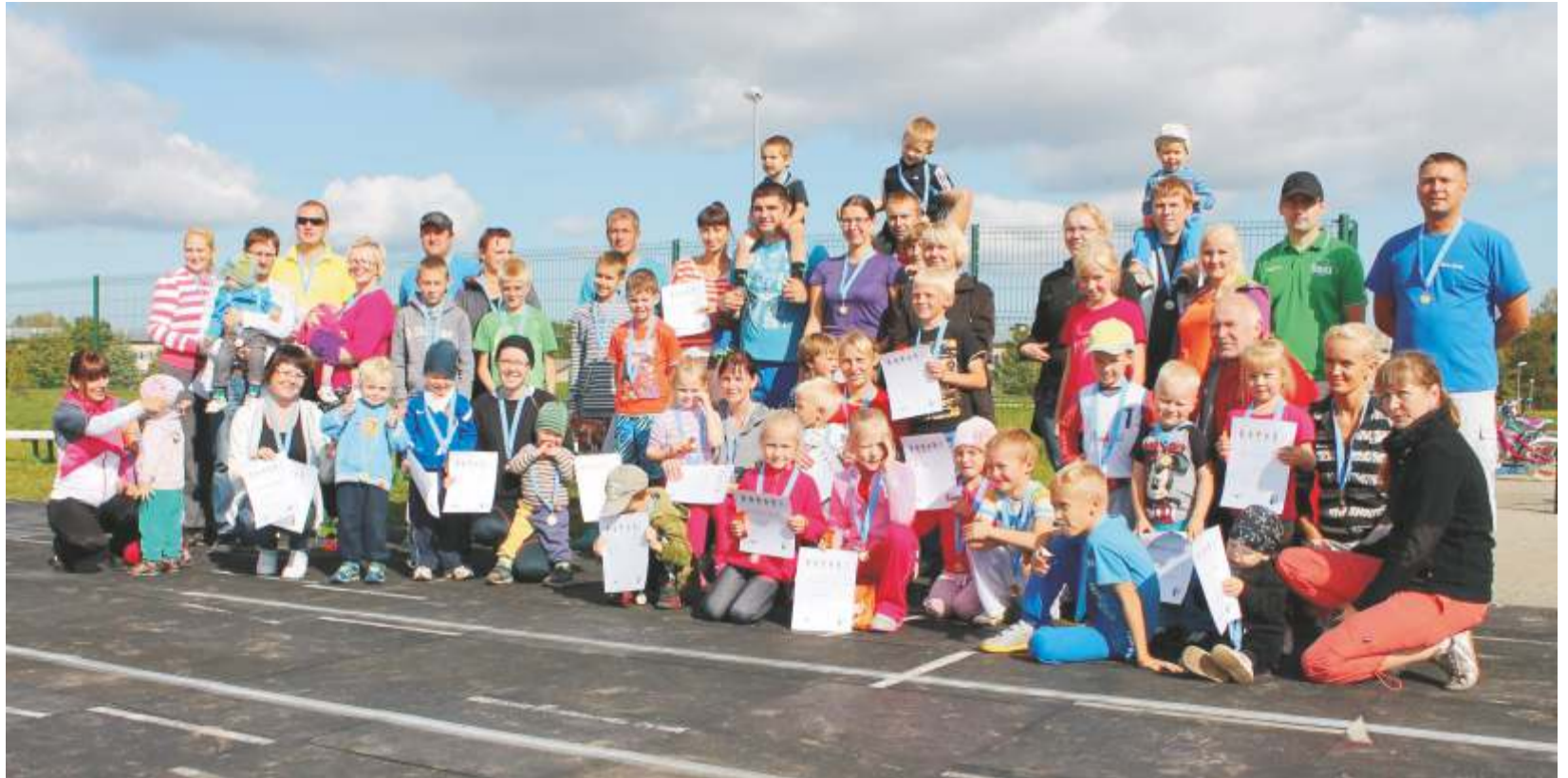
Rõõmus spordiseltskond.