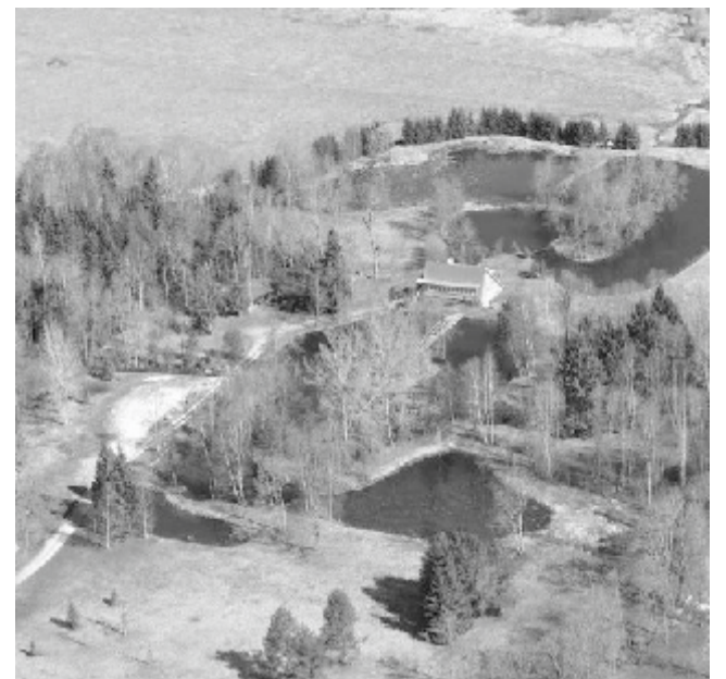
Juba aastaid teatakse Võle küla ka kalakasvanduse kaudu, kus praegugi võimalik mõnusalt aega veeta.

Erilise hoolega tuleb silma peal hoida lastel, kellel üldjuhul veega kokkupuude puutub. Vastutus lapse elu ja tervi-