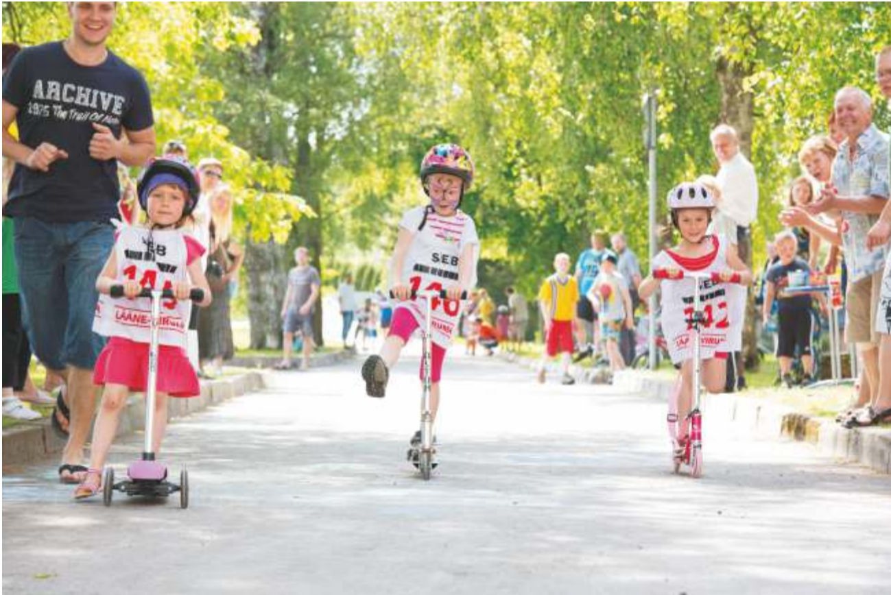
Tõukerattaralli pakkus põnevust nii võistlejatele kui pealtvaatajatele.