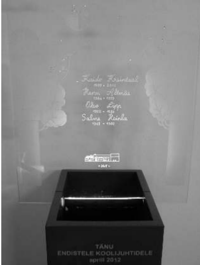
Tänuhvelit on võimalik oma silmaga kaeda kooli fuajees.