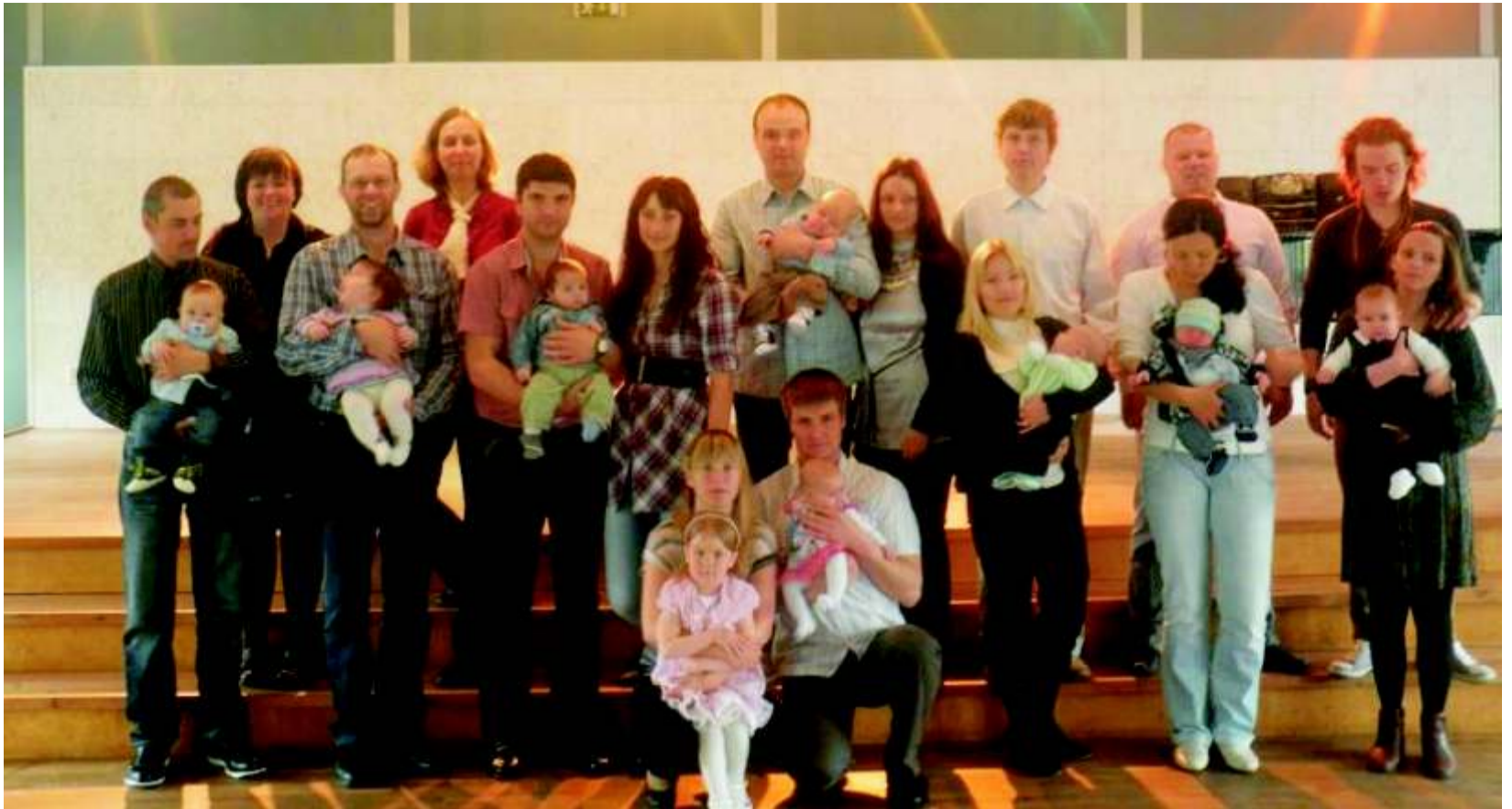
Haljala valla uued kodanikud koos vanematega.