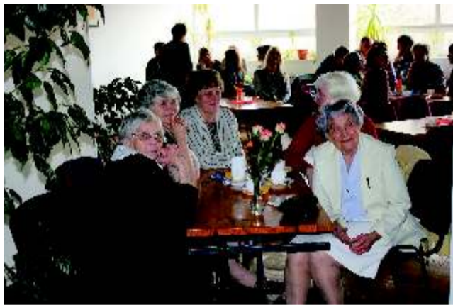
Koolikohvikus võis kohvi ja kringli kõrvale kuulata ettekandeid kooli ajaloo, muusikapalu ja sõnavõtte. Kõik soovijad võisid jagada oma meenutusi Haljala koolist.