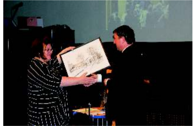
Vald ja kool käivad ikka käsikäes.