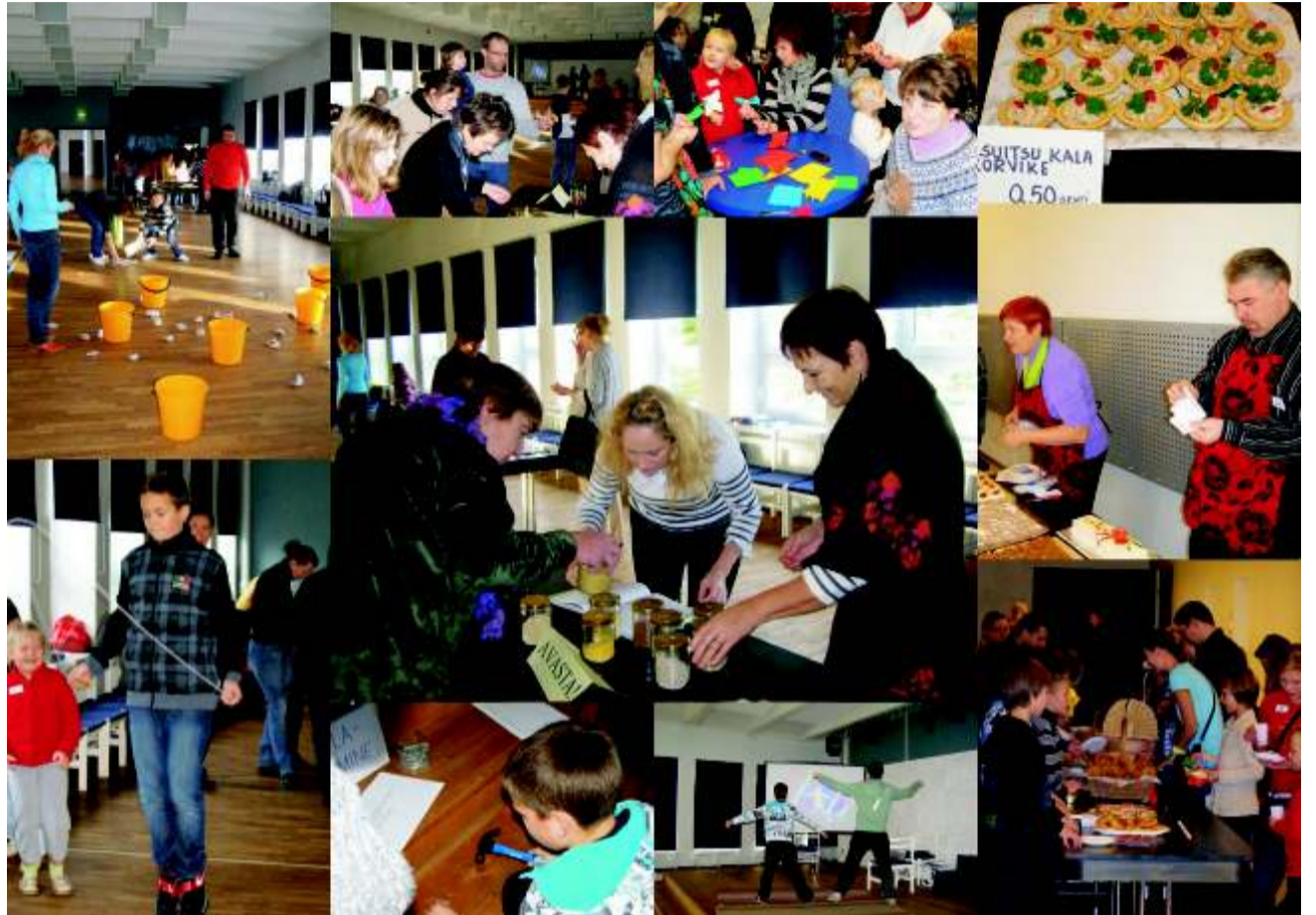
Perepäeval jätkus tegemist kõigile.

Võistlusemängud eeldavad ka võitjaid. Iga töötuba autasustas oma kategooria tublimat perekonda. Nii selgusid näiteks tublim matemaatikat või loodust tundev perekond, kõige nobedam või tervem perekond. Rõõmsat elevust pakkusid päeva lõpetuseks Piip ja Tuut etendusega kogu perele.