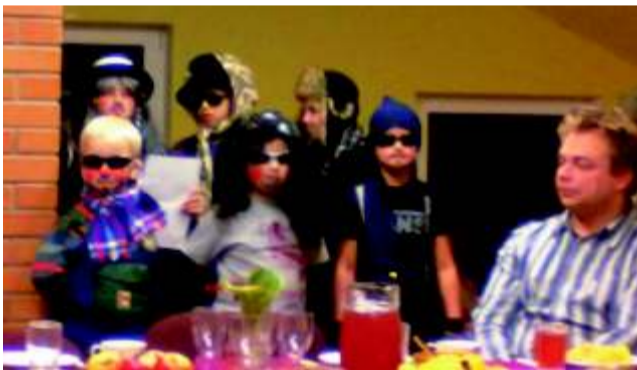
Väikesed mardid majaõnne soovimas.

Mardipäev on üks olulisemaid sügise rahvakalendri tähtpäevi, mis vanasti tähistas talve algust ja põllutööde lõppu. Läbi aegade on saanud kombeks, et mardisandid nii maal kui linnas perest peresse käivad, paludes luba tuppastuda. Mõnel pool katab pererahvas selleks puhuks pidulaua ja kostitab sanditajaid hea ja paremaga.