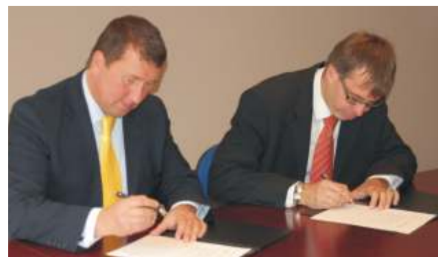
Heade kavatsuste kokkulepet allkirjastamas.

Kokkuleppe eesmärgiks on tagada konkurentsi-võimelise gümnaasiumihariduse omandamise võimalus ka tulevikus mõlemas omavalitsuses, ühise õppekava väljatöötamine ning piirkondliku koolivõrgu kujundamine. Ettepaneku kokkuleppe sõlmimiseks kiitsid eelnevalt heaks Haljala vallavolikogu ja Kunda linnavolikogu ning andsid Haljala vallavalitsusele ja Kunda linnavalitsusele volitused alustada koostööd.