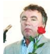
Urmas Osila Valimisliit Vaba Vallakodanik