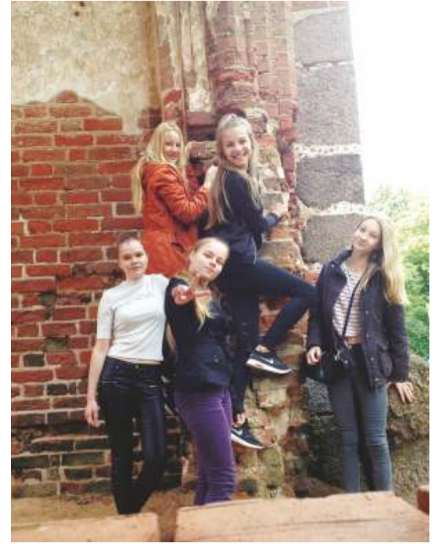
Võsu kooli õpilased õppereisil