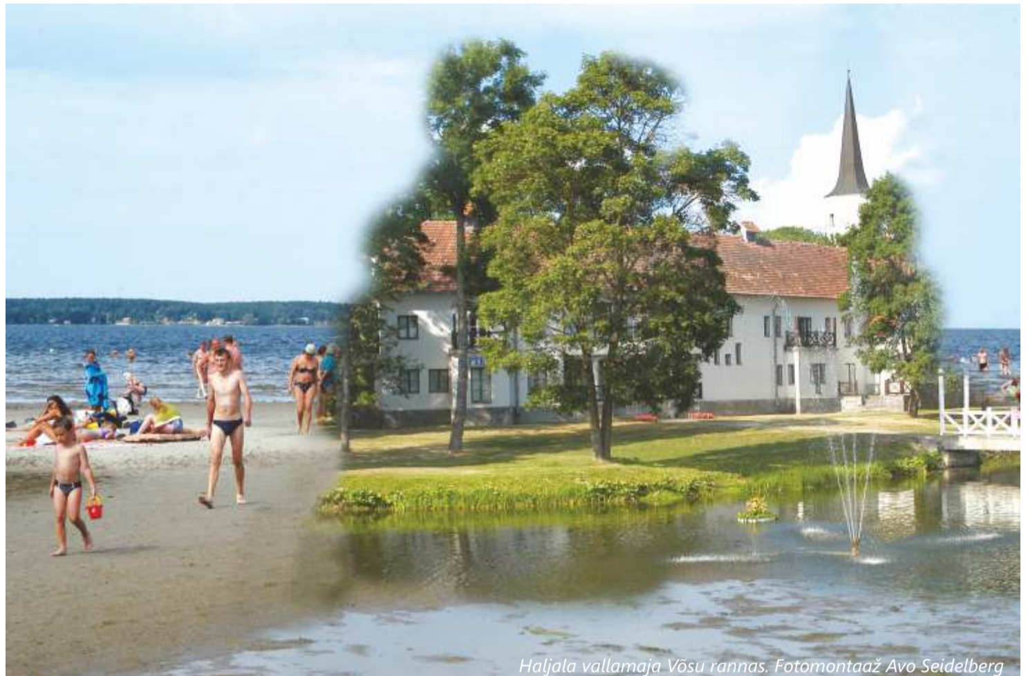
Haljala vallamaja Võsu rannas. Fotomontaaž Avo Seidelberg

19. novembril kell 17.00 Võsu rannaklubis