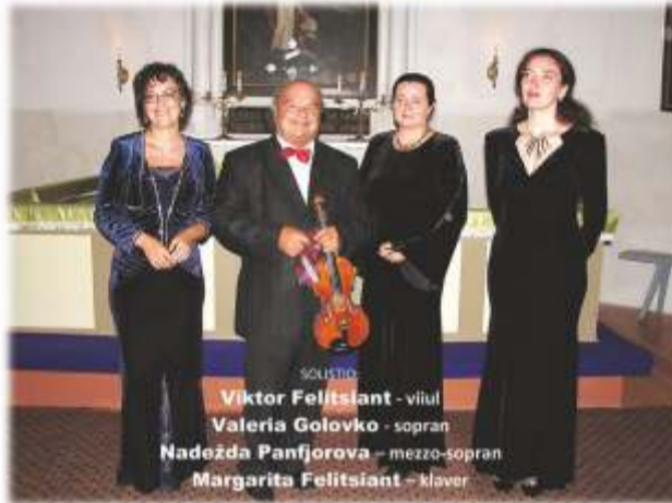
Piletid saadaval kohapeal: 10.- (lapsed ja pensionärid: 5.-) Lisainfo tel 5143089