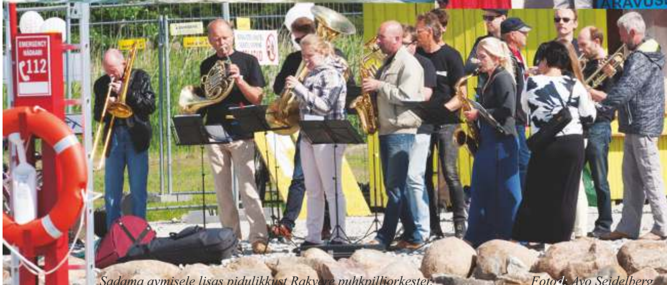
Sadama avmisele lihas pidulikkust Rakvere puhkpilliorkester.