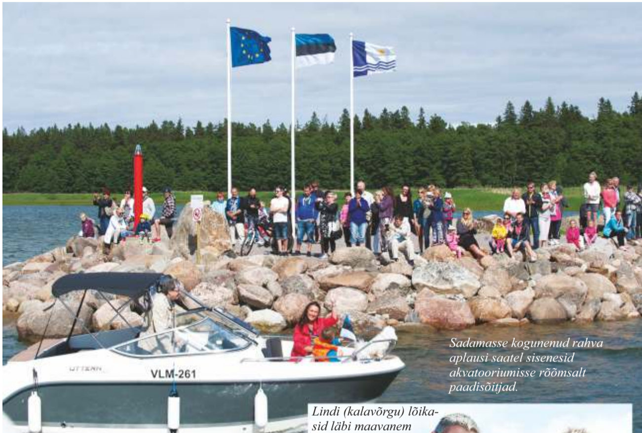
Sadamasse kogunenud rahva aplausi saatel sisenesid akvatooriumisse rõõmsalt paadisõitjad.

Laupäeval, 11. juulil, avati rahvarohkelt Võsu sadam.