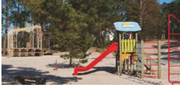
Võsu rand ootab suvitajaid uuendatud laululava ja mänguväljakuga

Randade ametlikuks avamisajaks on tänava esimene juuni, kuid vallavanema väitel olid rannad tunduvalt varem valmis küllastajaid vastu võtma ja seda mitte ainult Võsu rannas, milline ootab suvitajaid uuendatud laululava ja mänguväljakuga. Samuti on oodata uusi toitlustuskohti. Sel aastal korraldati ka Vergi ja Käsmu ujumiskohti. Laiendatud parkimisplatsi ja uue välikäimla sai Karepa rand. Seda kõike vallavalitsuse rahastamisel ja kohalike tegijate toel.