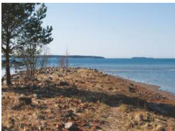
Siia tuleb sadam

Sadamat asub ehitama OÜ Monoliit. Sadama ehituseks on raha eraldanud PRIA.