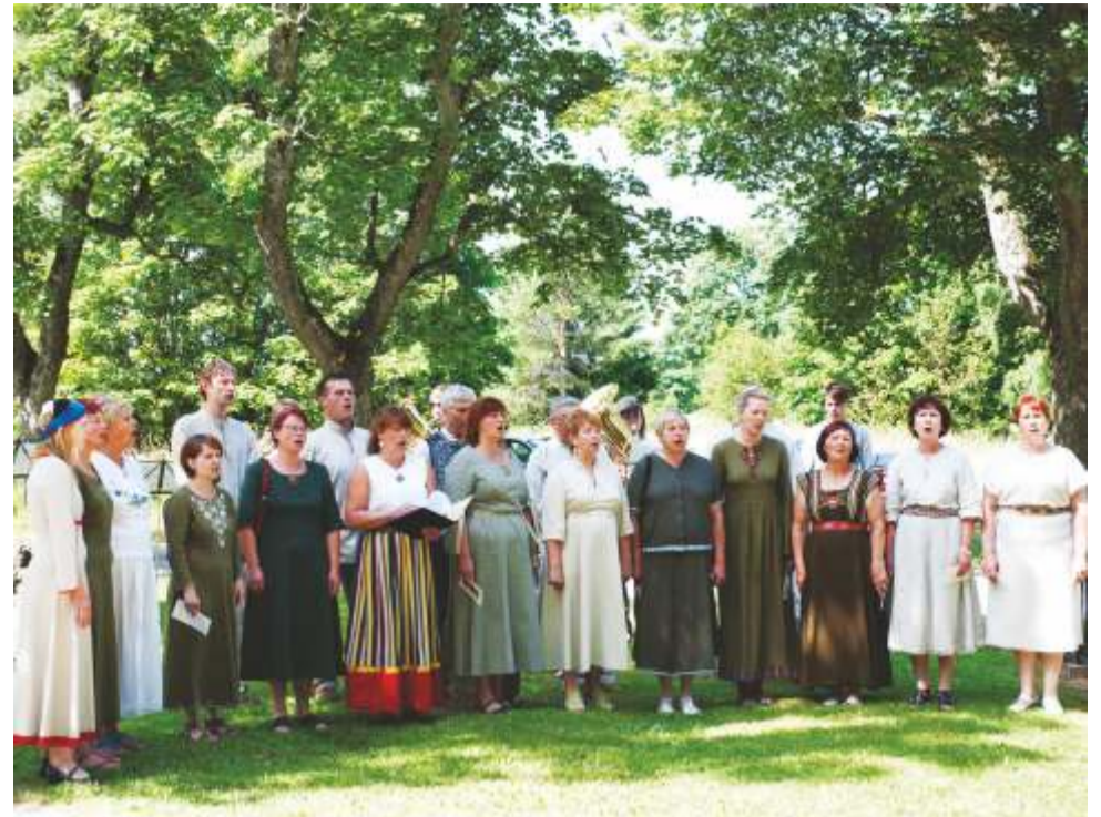
Segakoor Ilumäe vabadussamba 90. aastapäeva üritusel

Tõrvatilgaks meepotis on meie kallis ja väljast poolt kullakarvaline, seest endiselt