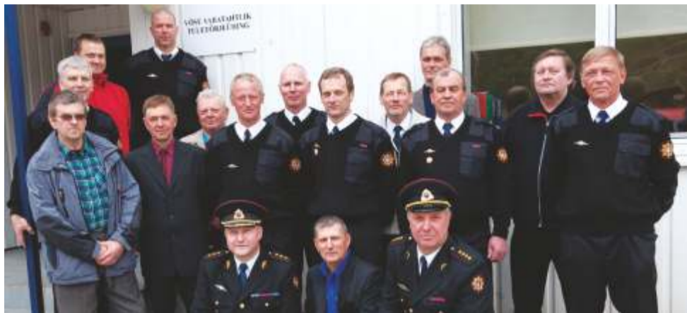
Võsu Vabatahtlik Tuletõrjeühing