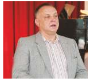
Annes Naan vallavanem