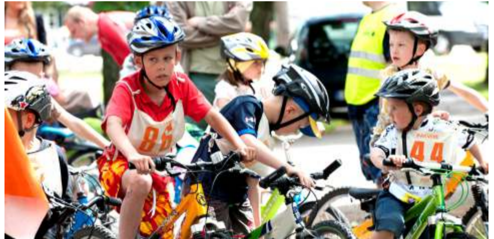
Rattapäeval sõidavad kõik kiivrites