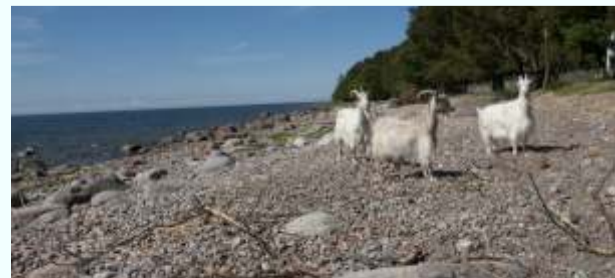
Vihula vald on küll kauni loodusega rannaäärne maalapp, väga atraktiivne turistidele, kuid üha vähem atraktiivne nooremajapoolsele püsielanikkonnale.