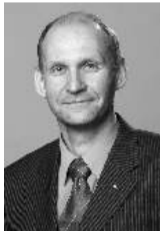
Helir-Valdor Seeder põllumajandusminister

Teguderohket 2008. aastat kõikidele peredele!