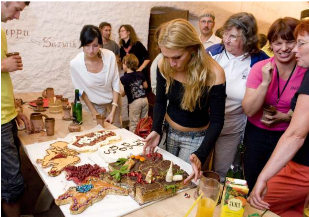
Valla erinevate piirkondade esindajad olid valla päevaks küpsetanud oma territooriumi kujulised koogitükid, mida õhtul Palmse körtsis üritati vallaks kokku sulatada.

23. augustil Palmse mõisas toimunud Vihula valla päeval, anti vallavolikogu ja vallavalitsuse tänukirjad regilauluansamblile TINK-TIN-GADI ning Palmse, Sagadi ja Vihula mõisa töötajatele tänuväärse töö eest kodukandi kultuuri ja ajaloo säilitamise eest.