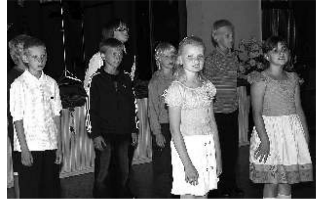
Hetk Vihula kooli suvel peetud juubeliteemal.

Vallavalitsuse nimel tahan tänada meie raamatukogude juhatajaid, kes viies erinevas kohas on kui vallavalitsuse käepikendused – nende kaasabil jõuab info teieni ja tagasi meieni. Loodan, et selline infovahetus elavneb aga veelgi ning me kõik mõistaksime, et tänane raamatukogu ei ole pelgalt laenutuspunkt, vaid arvestatav osa vallavalitsuse tervikust.