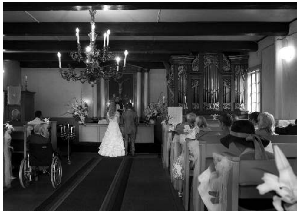
Laulatus Käsmu kirikus 2011. a

Laulatustalitust toimub reeglina kirikus, aga on ka erandeid. Viimastel aastatel on laulatuspaikadena populaarsust kogunud mõisad, kus on laulatus järele ka hea pulmapiidu pidada.