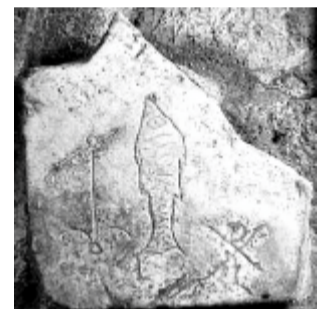
Varased kristlikud sümbolid Saint Sebastiani katakombides Roomas

Tänapäeval kasutavad kristlased oma esemetel tihti kalakujulisi kleepse, andes teada, kellesse nad usuvad.