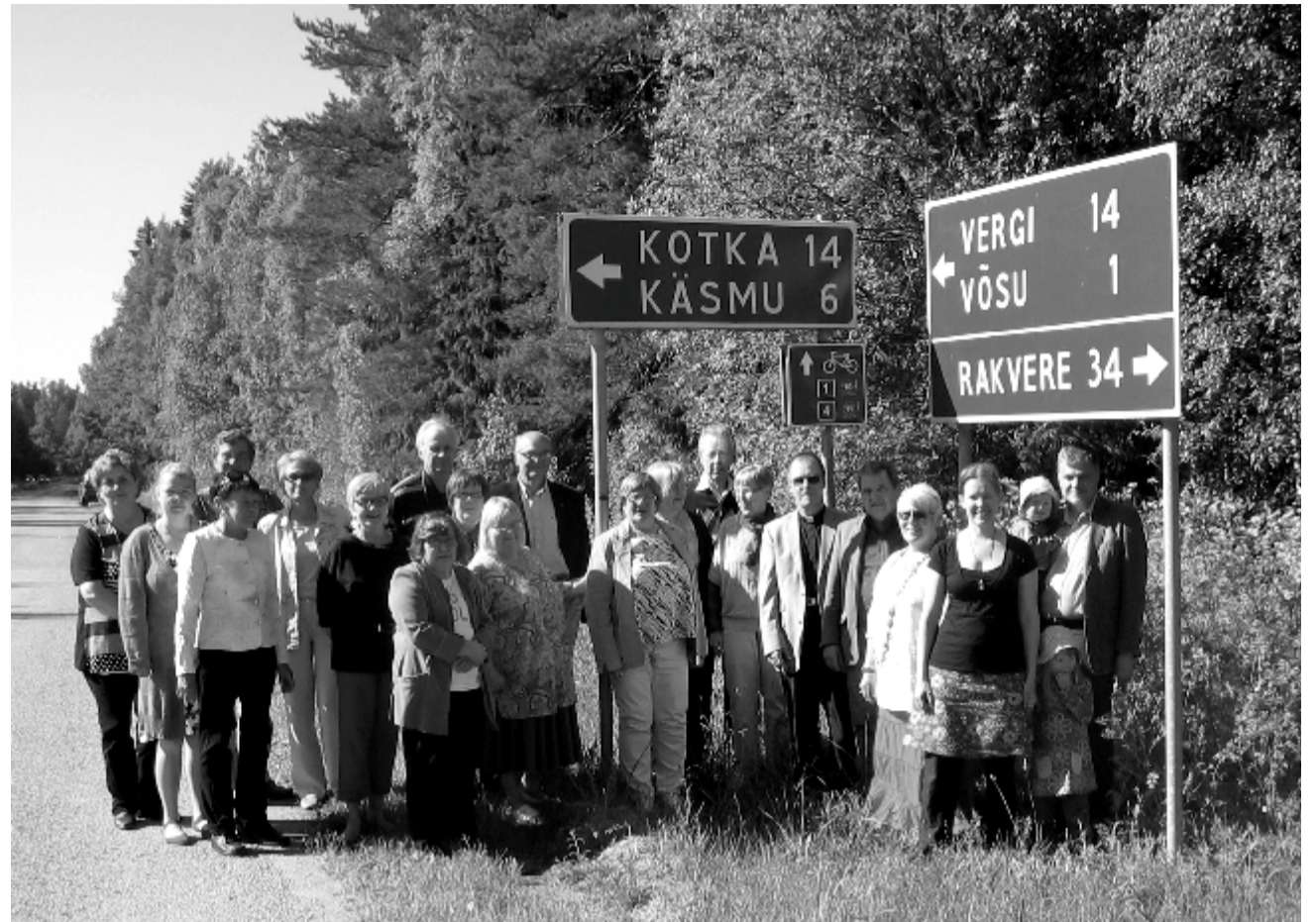
Käsmu koguduse rahvas koos Kotka linna Kymi sõpruskogudusega teeristil

Jaanipäev – see on pööramise päev. Meie siin sellel laiuskraadil oleme nii harjunud taolise rütmiga. Looduse rütm on juba aastasadu või isegi -tuhendeid meisse sisse harjunud; see on juba geenides. Oleme (siin) harrastanud oma rahvussporti – ilmaennustamist, mis käis ikka pööripäevade järgi. Jõulust jaani ja jaanist jõulu. Ja nii edasi. Ja tagasi. Jaanipäeva paiku on päike oma võimsuse tipus; inimeste süüdatud jaanilõkked rõhutavad veelgi seda. Justkui tahaks kin-