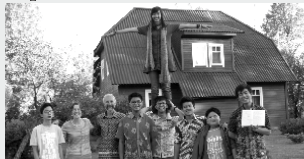
Indoneesia noored Sakussaares

Sakussaare kogudus võõrustas sellel suvel oma sõpru nii Udmurtiast, Inglismaalt kui ka kaugest saareriigist Indoneesiast.