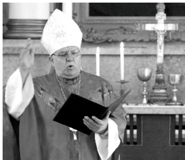
Piiskop Einar Soone