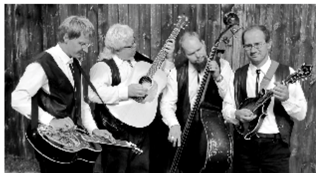
Kantrimuusika ansambel "Robirohi"

3. augustil toimus Sakussaare koguduses vabaõhukontsert "Sõnum muusikas", kus külaliseks oli kantrimuusika