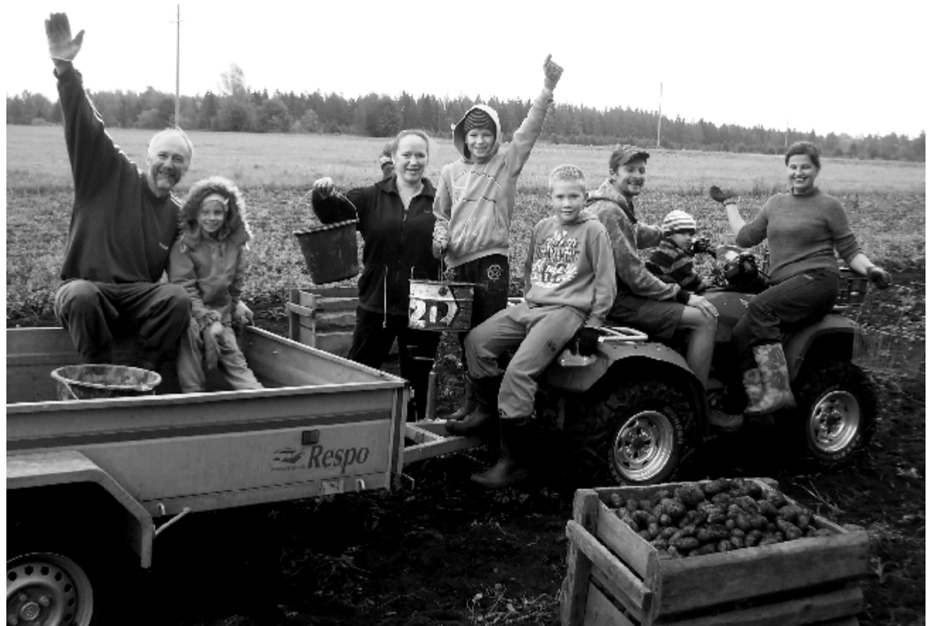
Kartulitalgud Vatku külas

Tema, kes annab seemne külvajale, annab ka leiva toiduseks, teeb rohkeks teie külvi ja kasvatab teie õiguse vilja. (2 Kor 9:10)