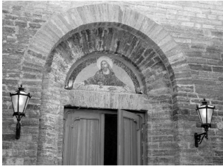
Narva Aleksandri kiriku peasissekäik.

mitu märkimisväärset seika. Kohal olid näiteks kuus piiskoppi neljast kirikust, kes teenisid erinevatel üritustel. Narva Aleksandri kirikus suudeti tähtajaks teostada Päästeameti poolt ettekirjutatud remonttööd ja saadi luba kirikusaal taas avalikkusele avada. Remonttööde kulud kanti kahasse riigi, linna ja kiriku poolt. Nelja Tuule ristirännaku vabatahtlikud suutsid kahe päevaga Aleksandri kiriku koristada ja jumalateenistusteks valmis seada. Kõige kaugemad abilised neil töodel olid Venemaalt Ingeri kiriku Uurali praostkonnast.