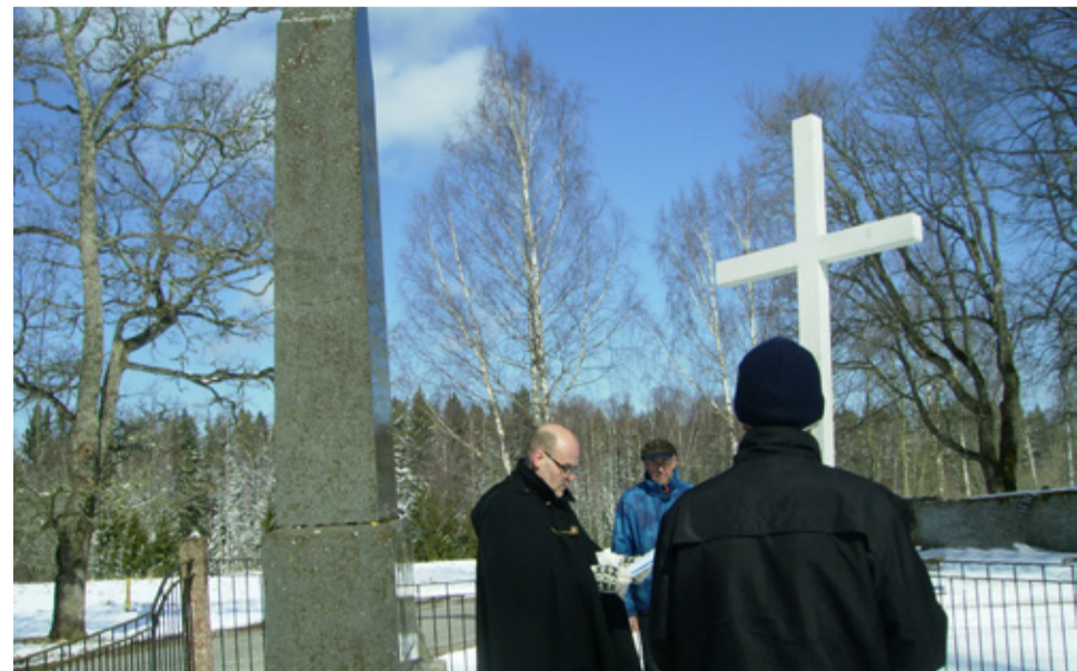
Ristitee Ilumäel.

Poega risti kandmas nähes ema rinnust pää-