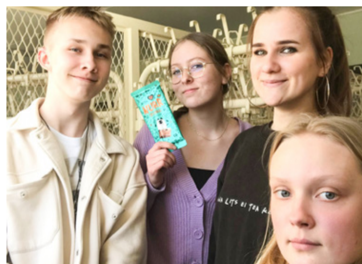
Märtsikuus tõi võistkond pinevas heitluses koju II koha.

Kui 8.ja 9. klass on esindasid meid maakonnas, siis 5.-6. klassi võistkond on juba aastaid võtnud mõõtu mälu-mänguturniiril "Mini-turniir". „Miniturniir“ on populaarne laste mälu-mängusaade, mis ins-piratsiooni saanud legendaarsest „Mnemoturniirist“. Haljala kooli võistkonna saade oli raadioeetris oktoobrikuus, saatejuht Ivo Linna