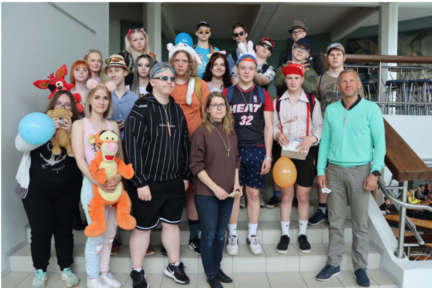
Maikuu lõpul tähistasid noored oma viimast koolikella tutipeoga.

Greete Toming Avalike suhete- ja projektijuht Haljala Kool