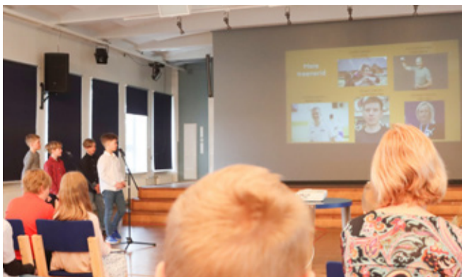
4. klassi õpilased tutvustasid kuulajatele ka oma treenereid.