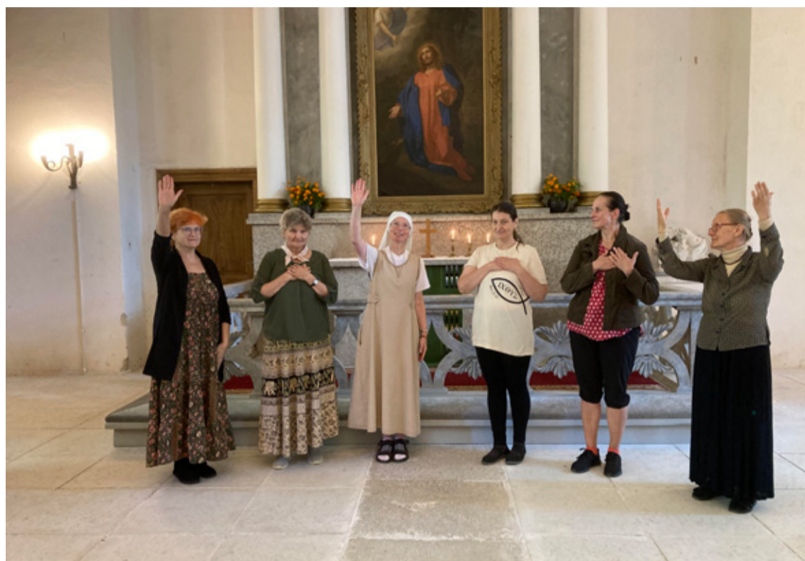
Armastust ja tänu Jumalale ning kaasteelisele saab väljendada ka tantsus, kus igal käte liigutusel ja tantsusammul on sügav tähendus. Palvetantsud koos öde Milladaga Ilumäe kirikus 7. septembril.

Pea tunnustama, et kuulmine kogukonda, kus on nii erinevate eelistustega inimesi, pole lihtne. Ammugi nende inimeste armastamine, kes on meist nii erinevad. Sest me mitte ainult ei istu igal pühapäeval samal jumalateenistusel, vaid me teeme koos ka otsuseid – nii nagu vabakiriklikule liikumisele kombeks. Osadel meist on rohkem ettevalmistust nende ot-