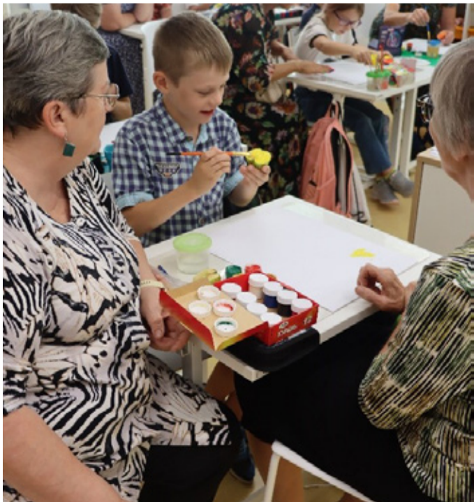
Õunapurgi moosiga täitmine tõi 2.A klassi mõnusa elevuse!